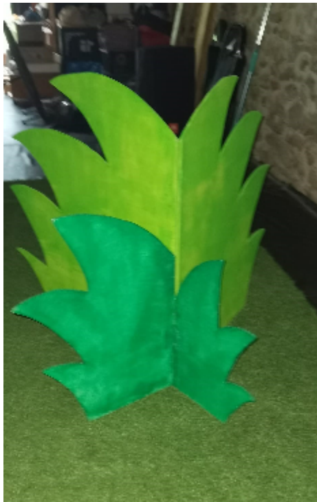
Fourré vue de face