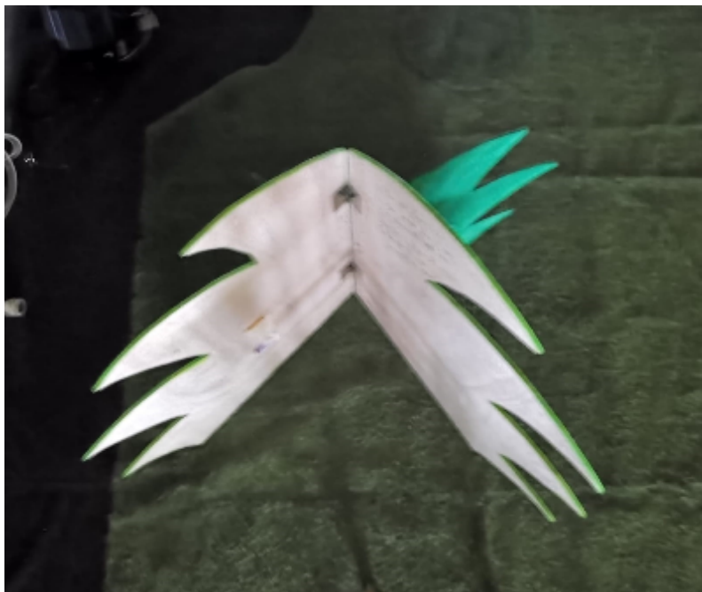
Fourré vue de Haut